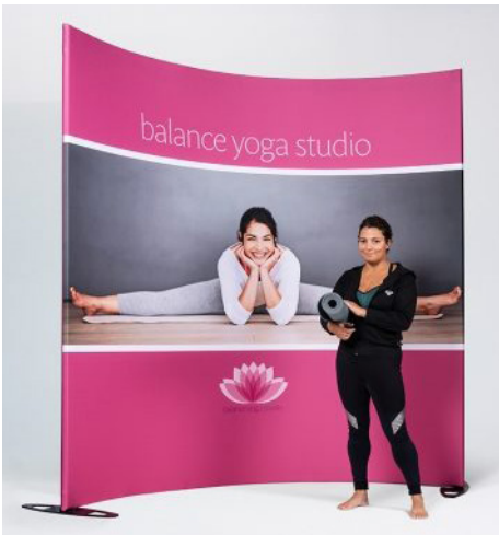
Radius 50 cm