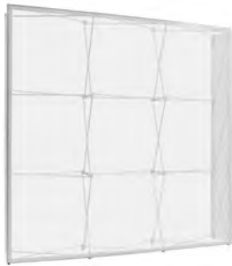
Faltsystem 3 x 3 gerade

Komplett 1'775.-- Nachproduktion Stoffprint 1'110.-- Inkl. 2 Seiten