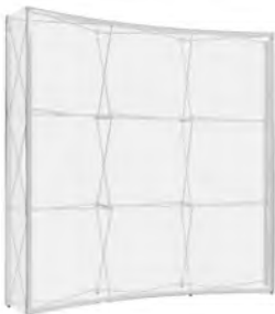
Faltsystem 3 x 3 curved

Komplett 1'855.-- Nachproduktion Stoffprint 1'140.-- Inkl. 2 Seiten