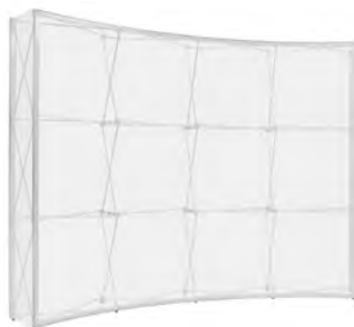
Faltsystem 4 x 3 curved

Komplett 1'545.-- Nachproduktion Stoffprint 975.-- Inkl. 2 Seiten